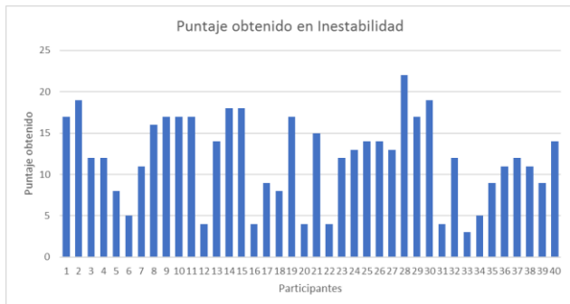
Figura 3. Puntaje obtenido en Cuestionario de Personalidad; categoría de inestabilidad.

un puntaje de 20. Los participantes 20 y 27 obtuvieron un puntaje de 19 y 18 respectivamente. La media de esta categoría fue de 15, esto quiere decir que la mayoría de los participantes tienen una extroversión con un nivel normal.