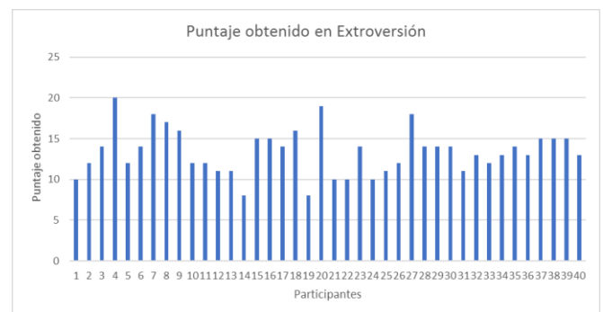
Figura 2. Puntaje obtenido en Cuestionario de Personalidad; categoría de extroversión.

Solo un participante obtuvo un puntaje de 0 (el número 1) y otro participante obtuvo un puntaje de 6 (el número 31); debido a esto se puede afirmar que no representan ningún problema con el uso del Internet.