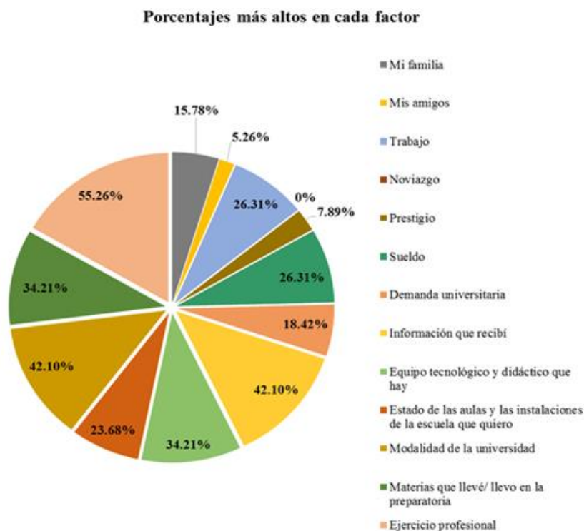
Figura 2. Representación gráfica de los factores con mayor importancia en la elección de carrera.

ejercicio profesional (55.26%); seguido de modalidad de la universidad y la información que recibieron (ambos con 42.10%), equipo tecnológico y materias que llevaron/llevan en la preparatoria (34.21% cada una), sueldo y trabajo (26.31%), los demás factores se encuentran por debajo del 25%, como se ilustra en la Figura 2. De los factores menos importantes se encontró que el noviazgo es nada importante.